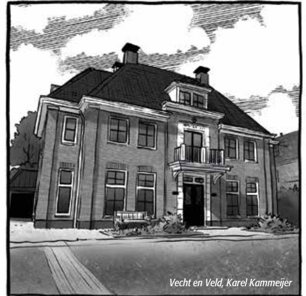
Vecht en Veld, Karel Kammeijer