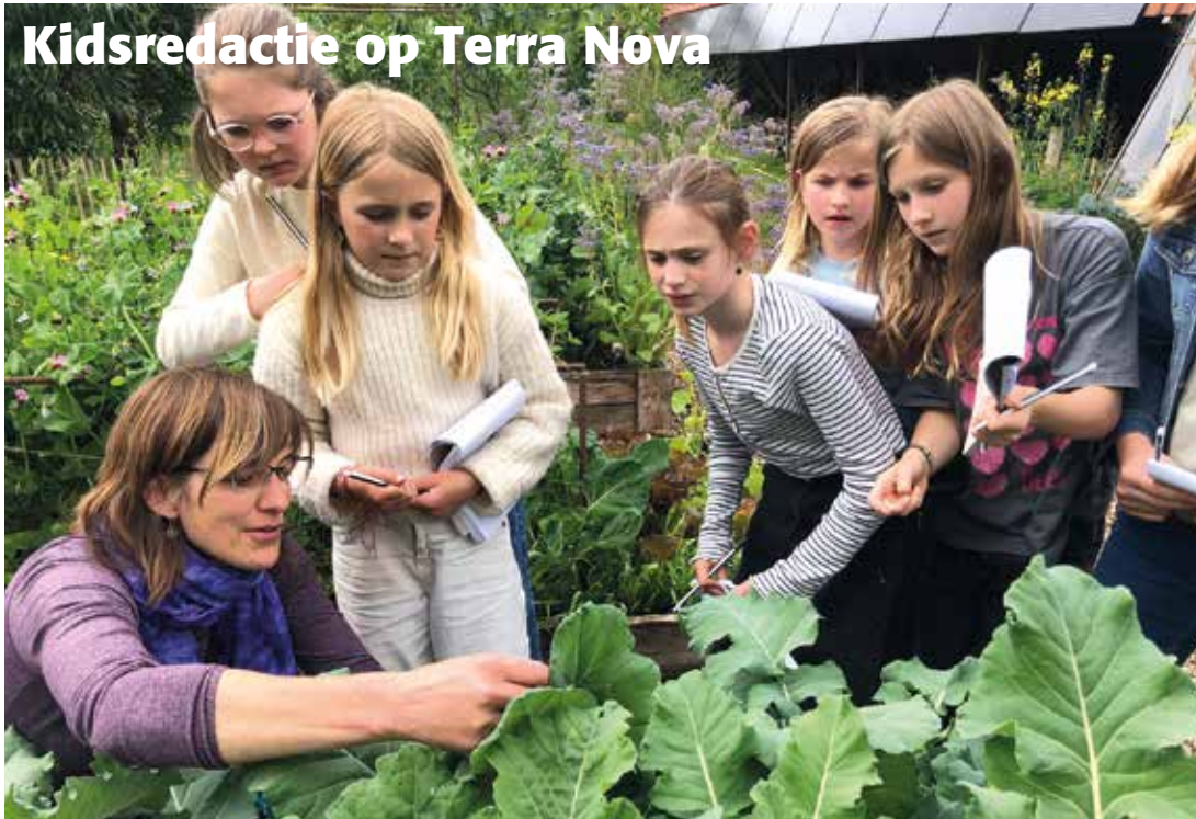
De Kidsredactie ging op excursie naar het voedselbos op Terra Nova. Een bijzondere en leerzame middag. Lees er meer over op de kinderpagina.