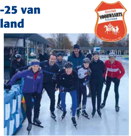
Afgelopen jaar was er een geslaagd uitje voor de leden naar de Jaap Edenbaan.

Voor komend schaatsseizoen hebben we een cool winterprogramma: in elke maand is er een leuke schaatsactiviteit voor jong en oud! Ben je nog geen lid? Meld je dan nu aan als lid op ijsclubvoorwaartsvreeland@gmail.com of kijk op de website: https://ijsclubvoorwaartsvreeland.nl/agenda/ . We zien je graag en zijn daarnaast op zoek naar