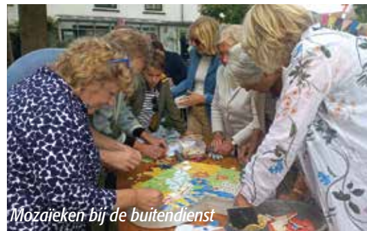
Mozajeken bij de buitendienst