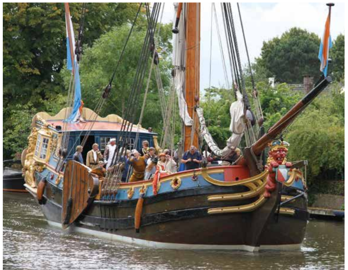
30 augustus 2014 werden de Vreelandse kloostermoppen teruggevaren.

Op een andere manier bijdragen aan het voortbestaan van dit varend erfgoed? Boek het schip voor een vaartocht met familie, vrienden of relaties. Voor meer informatie: www.statenjacht.nl .