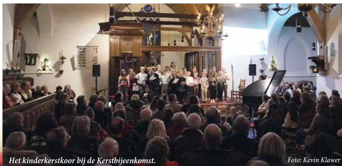
Het kinderkerstkoor bij de Kerstbijeenkomst.