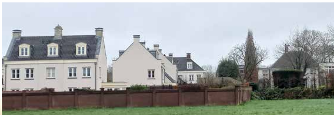
De Ludgerushof, genoemd naar de heilige Ludgerus waaraan de oorspronkelijke en de nieuwe katholieke kerk waren gewijd.