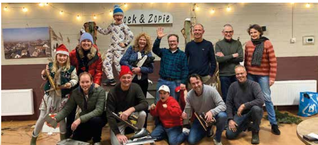
Afgelopen zaterdag was het gezellig druk bij de gratis workshop schaatsen slijpen in het Dorpshuis, georganiseerd door IJclub Voorwaarts.