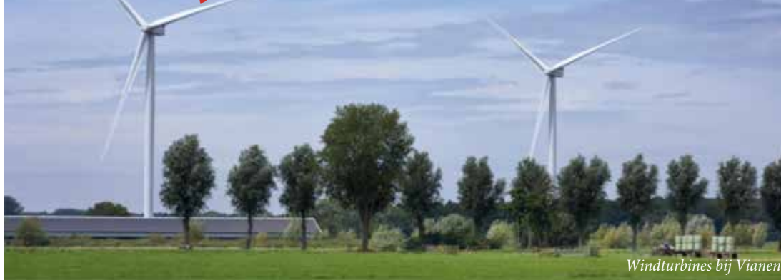
Windturbines bij Vianen