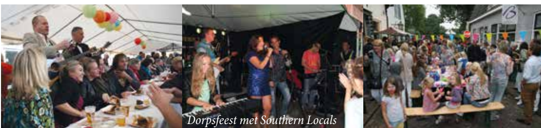
Dorpsfeest met Southern Locals

Wie nemen het stokje over om dit jaar het Dorpsfeest te organiseren? De datum staat al (13 september 2025) en er is een uitgebreid draaiboek en uiteraard ondersteunen zowel het bestuur van Ondernemend Vreeland als ook de oudgedienden waar nodig, om er samen weer een prachtig feest van te maken. Lijkt het je leuk om, samen met je vrienden en/of burens, vanaf volgend jaar het Dorpsfeest te organiseren? Meld je dan aan via secretariaat@ondernemendvreeland.nl .