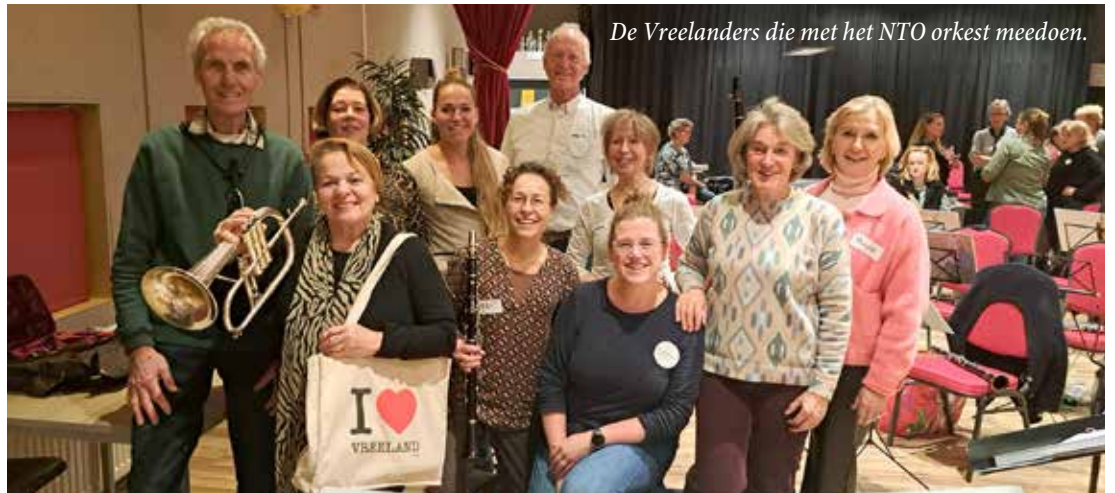
De Vreelanders die met het NTO orkest meedoen.