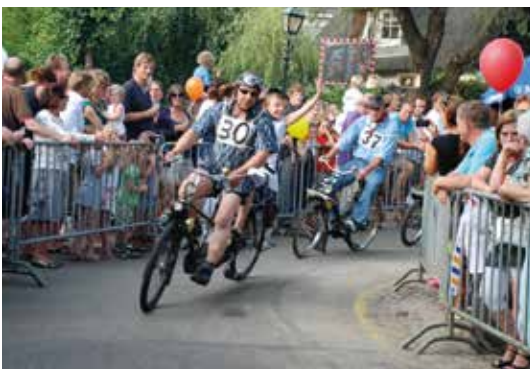
Dorpsfeest met brommerrace

Maar eerst gaan we nog even terug in de tijd. Want door de jaren heen is de invulling van het Dorpsfeest steeds een beetje aangepast aan de tijdsgeest. Het begon ooit met een brommerrace door het oude dorp.