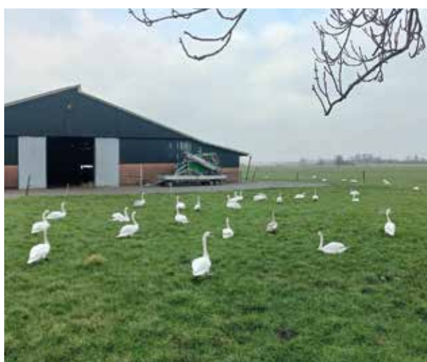
Maar liefst 38 zwanen schoolden onlangs samen in het weiland van Breëvecht aan de Nigtevechtseweg.