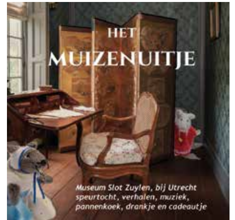
Museum Slot Zuylen, bij Utrecht speurtocht, verhalen, muziek, pannenkoek, drankje en cadeautje

Overal in dit mooie kasteel zitten muizen verstoppt, van ridders tot jonkvrouwen tot huispersoneel. In het kasteel kun je ook genieten van leuke verhalen en mooie muizenmuziek. Café Het Koetshuis serveert een lekkere muizenpannenkoek die je zelf versiert, met een drankje erbij. Hier kun je ook je eigen schilderij van Slot Zuylen inkleuren. In de kasteeltuinen kun je de bloeiende stinzenplantjes bewonderen. Kijk op www.slotzuylen.nl voor alle informatie.