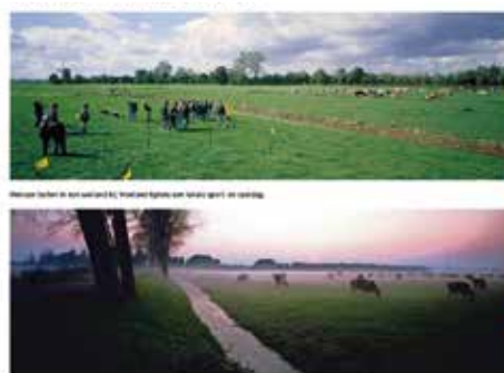
FOTOGRAAF Bert Verhoeff legde het vast, in het spoor van Nescio

reacties geleid. Regionale, provinciale en nationale tv (Hart van Nederland) besteedden aandacht aan dit thema.