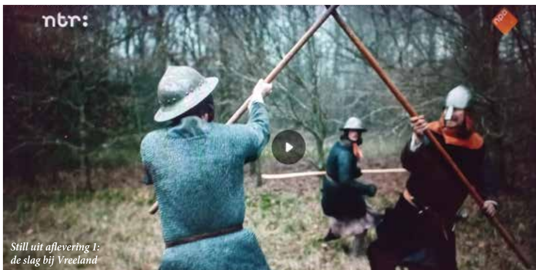
Still uit aflevering 1: de slag bij Vreeland