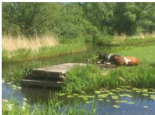
Koeien aan de Kortenhoefsedijk.